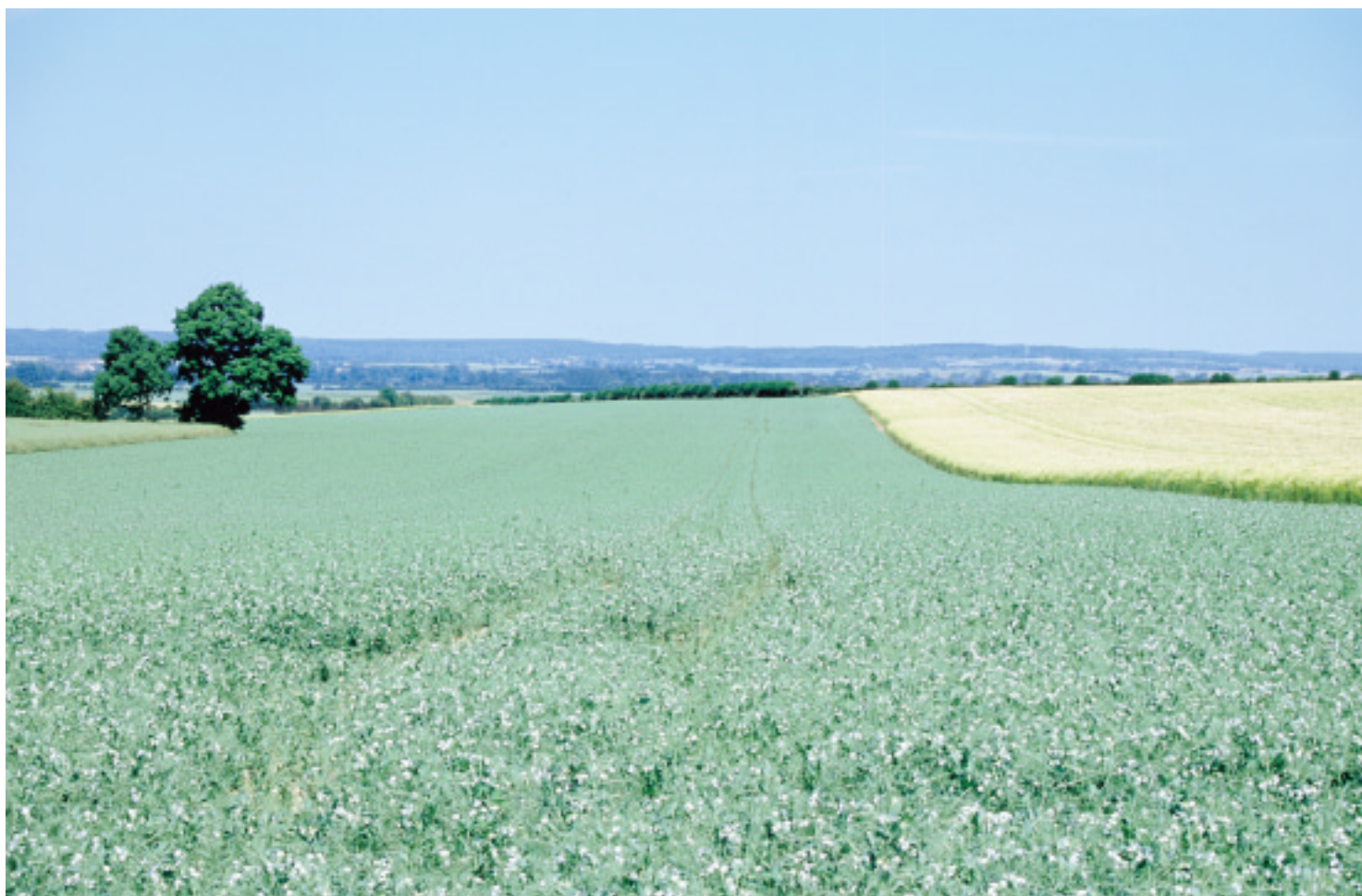
Ci-dessus : La plaine d'Argentan à Sentilly, fermée au Nord par la forêt de la Grande Gouffern.