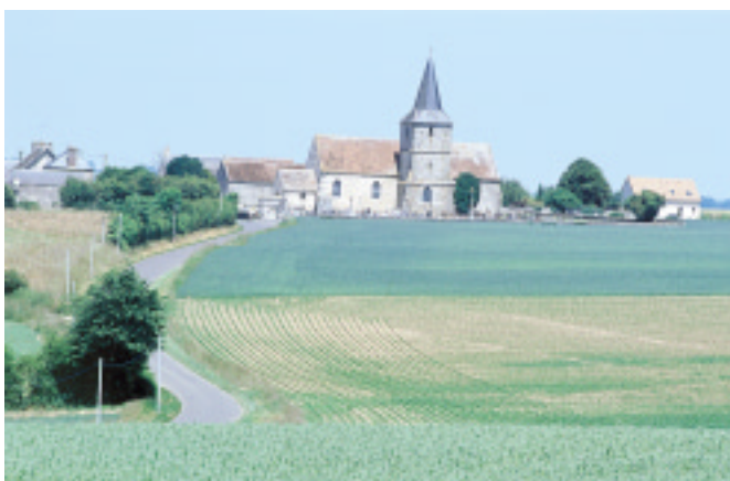
Ci-contre : Maison récente près de l'église de Joué-du-Plain.