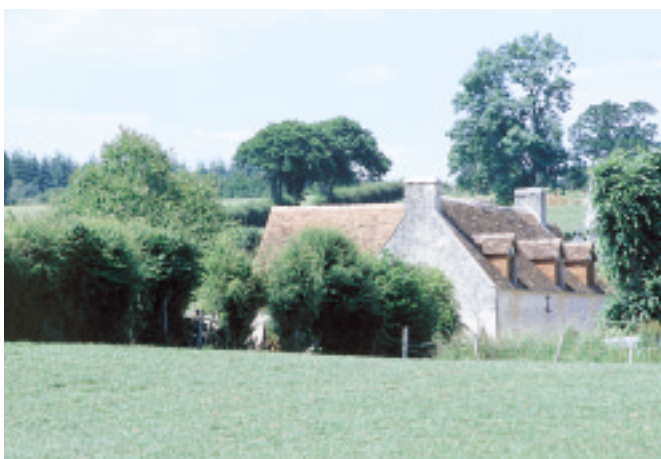
Ci-contre : L'habitat traditionnel à Montgaroult.

D'autre part, le développement d'un habitat périurbain autour d'Argentan distribue, le long de certaines routes, des lotissements de maisons à crépis clairs qui surgissent de manière incongrue sur le grand échiquier des labours.